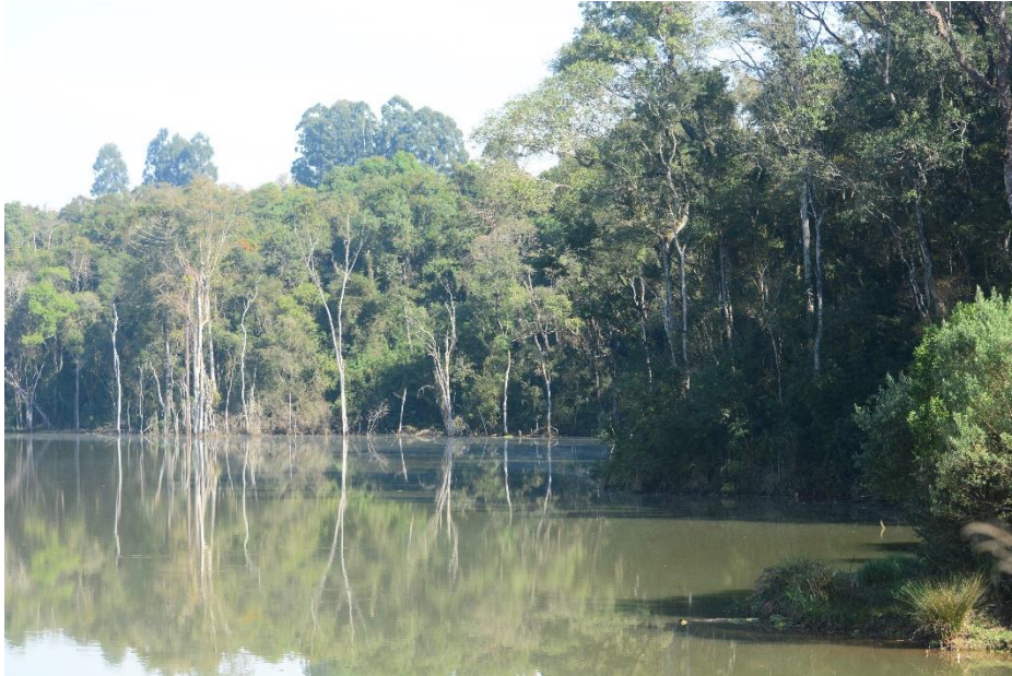
Figura 3.1.2.2 Fragmento amostrado na margem do reservatório no Sítio Amostral 2.