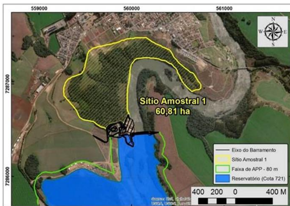
Figura 3.1.1.1 Localização do Sítio Amostral 1

Localizado a jusante da barragem da UHE Tibagi Montante, na margem esquerda do rio Tibagi, próximo às imediações da cidade de mesmo nome. O Sítio Amostral 1 possui uma área de 60,81 ha e contempla um remanescente de Floresta Ombrófila Mista com influência da Floresta Estacional Semidecidual.