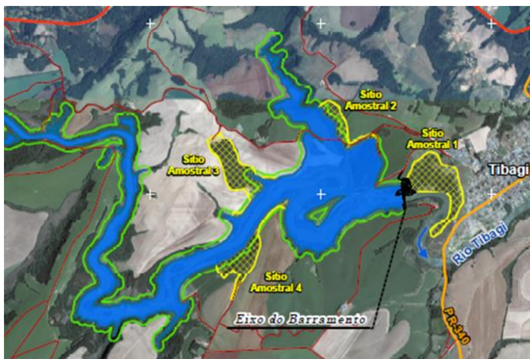
Figura 3.1.1 Localização dos 4 sítios amostrais do Programa de Monitoramento da Fauna Terrestre da UHE Tibagi Montante.