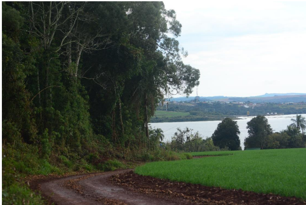
Figura 3.1.3.2 Estrada margeando ambiental florestal, amostrado durante as avaliações de fauna terrestre no sítio amostral 3.