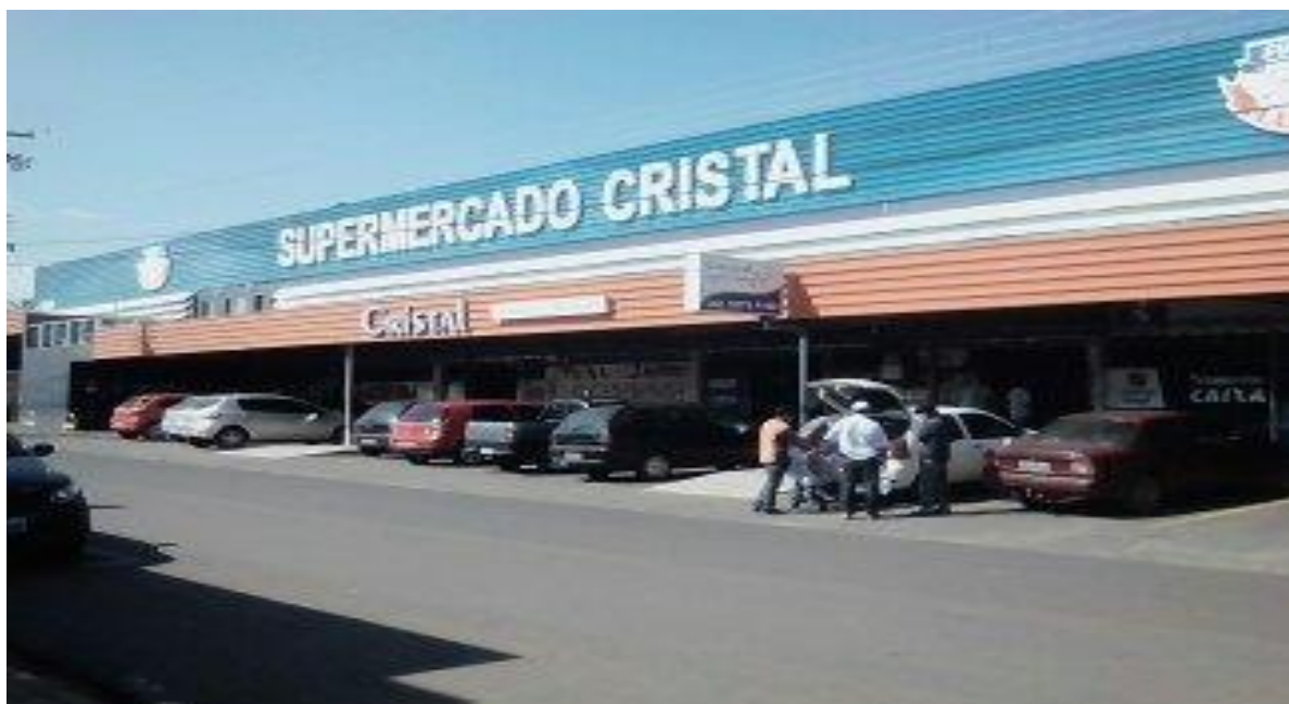
Supermercado Cristal (local onde a pesquisa foi realizada pessoalmente)