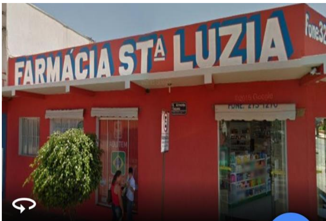
Farmácia Santa Luzia (local onde a pesquisa foi realizada pessoalmente)