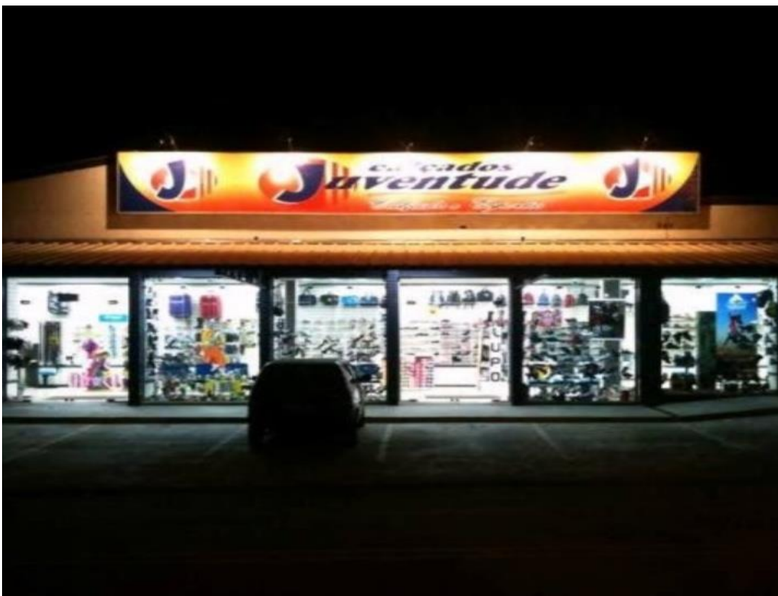
Calçados Juventude (local onde a pesquisa foi realizada pessoalmente)