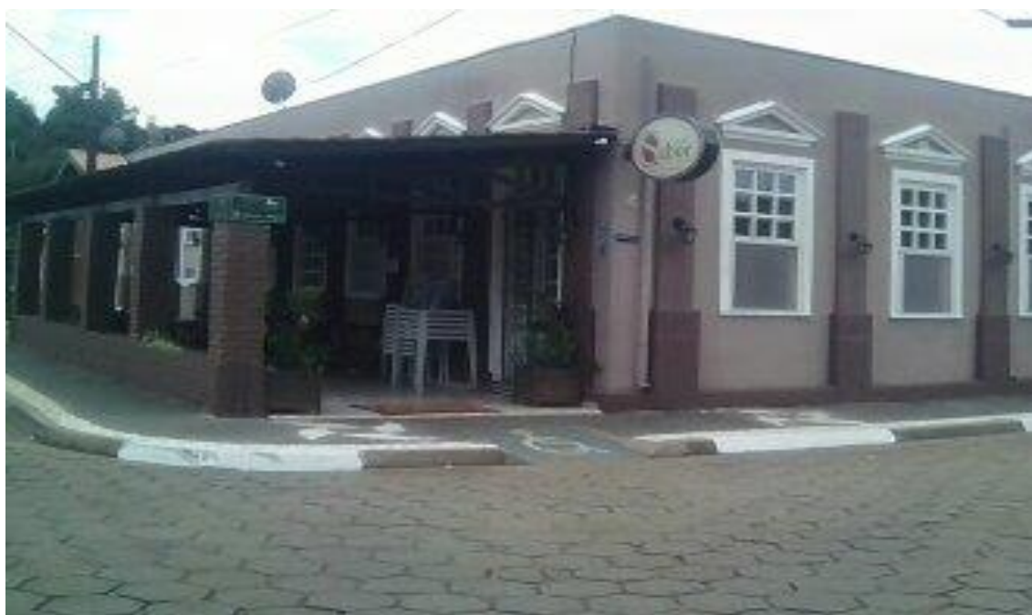
Restaurante Cia do Sabor (local onde a pesquisa foi realizada pessoalmente)