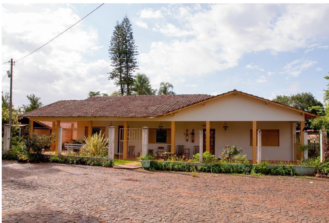
Pousada Longe Vista (local onde a pesquisa foi realizada pessoalmente)